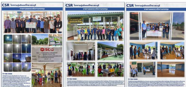
การตรวจรับงานและส่งมอบโครงการปี 2566