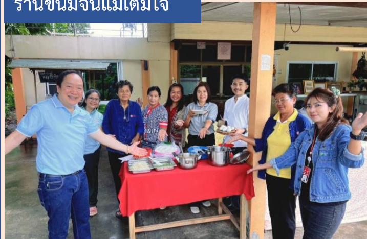
ร้านขนมจีนแม่เต็มใจ